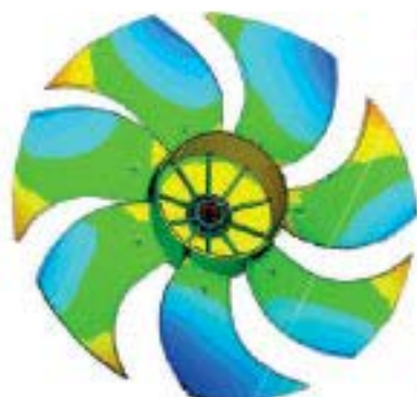
Verifica Dimensionale Palettamenti Ventola

Accessorio per tastatura manuale di zone nascoste o specifiche geometrie semplici