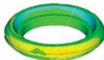
Verifica Dimensionale Guarnizione 1"