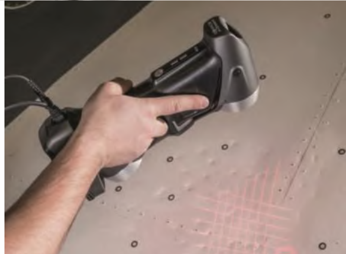
Scanner Manuale portatile per rilievi di particolari di piccole dimensioni