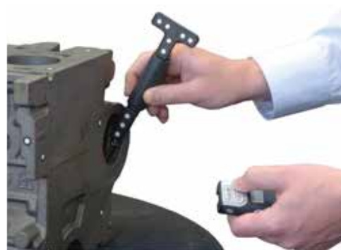
Touch Probe Accessorio per TASTATURA A CONTATTO di zone nascoste