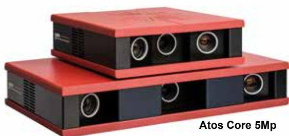
Atos Core 5Mp