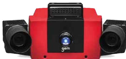
Atos Compact 12Mp