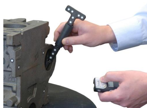
Touch Probe Accessorio per TASTATURA A CONTATTO di zone nascoste