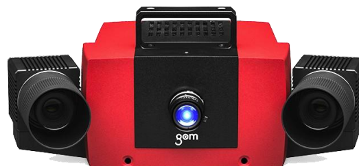
Atos Compact 12Mp