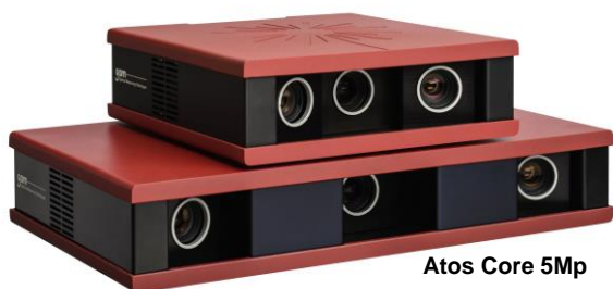
Atos Core 5Mp