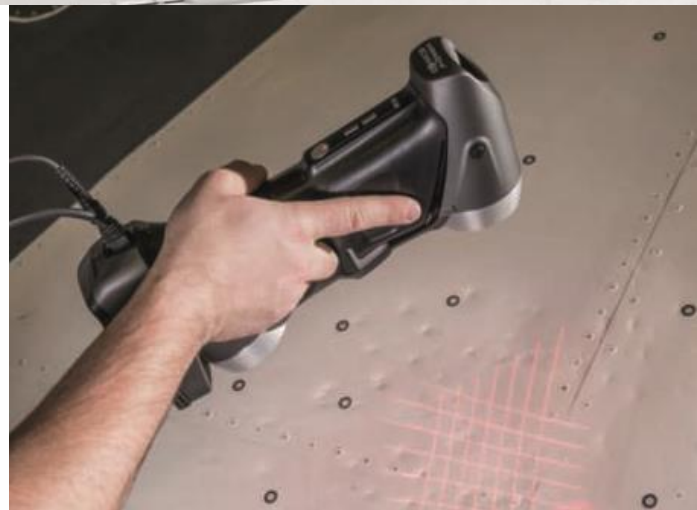
Scanner Manuale portatile per rilievi di particolari di piccole dimensioni

Siamo dotati di 2 rilevatori di volume che montati contrapposti, nella nostra cabina di misura, ci permettono di digitalizzare oggetti di ogni tipo, forma e superficie senza trattamenti di preparazione .